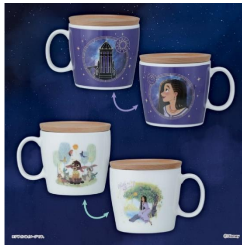
▲ウィッシュ プレミアム木蓋付マグカップ ～GiGO 限定～