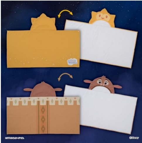
▲ウィッシュ プレミアムフード付パスタオル ～GiGO 限定～