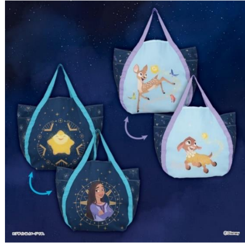
▲ウィッシュ プレミアムバルーンバッグ ～GiGO 限定～