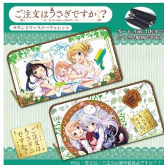
▲ご注文はうさぎですか?? ファスナーウォレット3