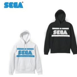
▲SEGA プレミアムパーカー